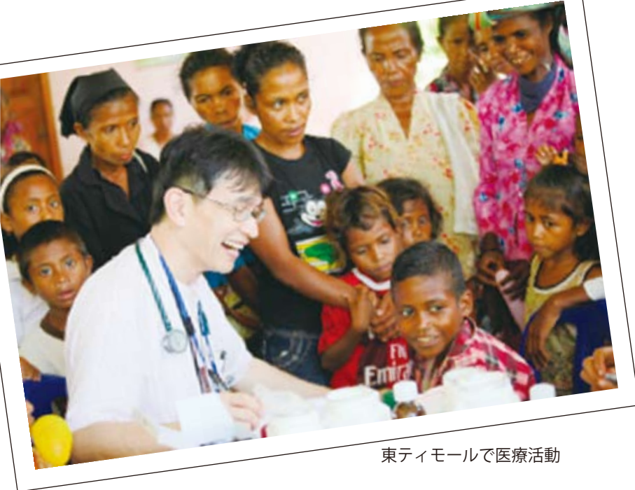
東ティモールで医療活動

精神科医の桑山紀彦氏が旅をし、活動をした国々での映像を大画面に映し出し、語りと音楽で綴る新しい形式のコンサートステージです。全国の学校現場を中心に、行政、国際交流関係団体などの主催により、年間 200 回ほどの公演を行っています。