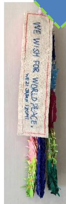
←いずみの鶴が、ニューヨークへ！